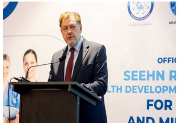
PROF. DR. ALEXANDRU RAFILA MINISTRUL SĂNĂTĂȚII DIN ROMÂNIA